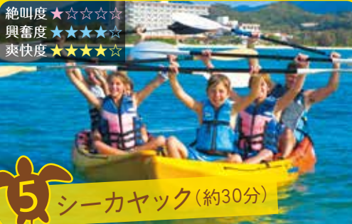
5 シーカヤック (約30分)