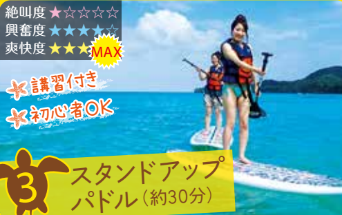
3 スタンドアップパドル (約30分)