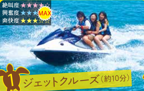
1 ジェットクルーズ (約10分)