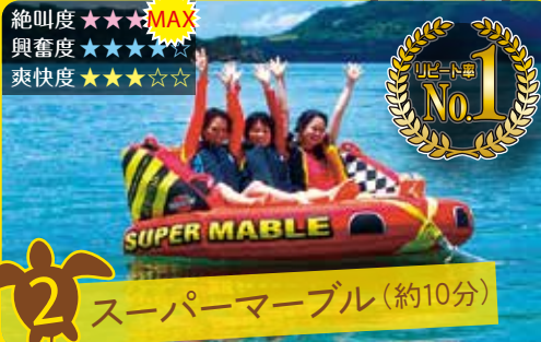
2 スーパーマブル (約10分)