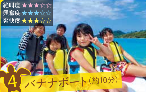
4 バナナボート (約10分)