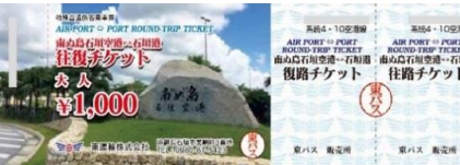
空港・港往復割引乗車券販売中