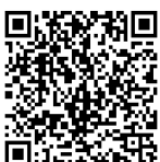
バスターミナル地図